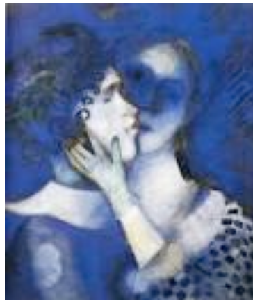
“Blue lovers” Marc Chagall